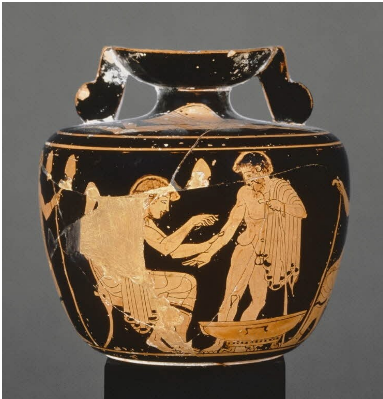
Aryballe à figures rouges, v. 480-470 av. J.-C., musée du Louvre