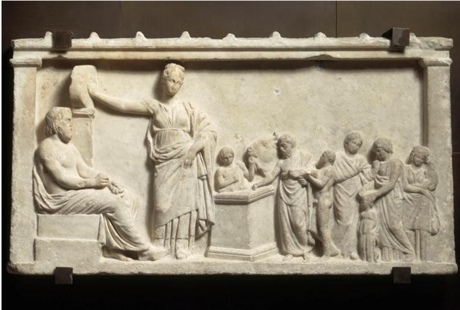
Relief votif ; sacrifice à Asclépios et Hygie, IVe s av., musée du Louvre